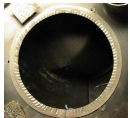
figuur onder: Belned tussenring op Bose 901 kast