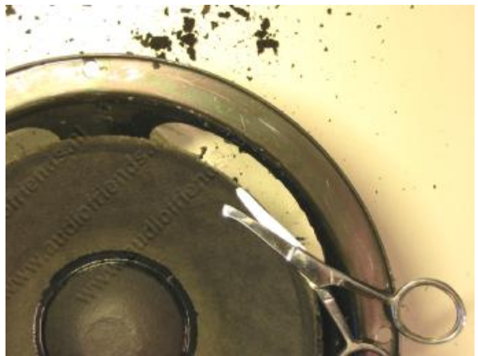
14. Deze knippen we er voorzichtig af met een klein schaarje.