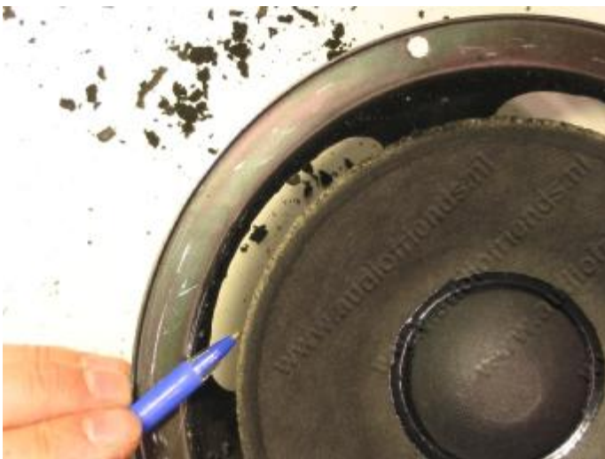
13. Er kan een uitstekende lijmlaag blijven zitten.