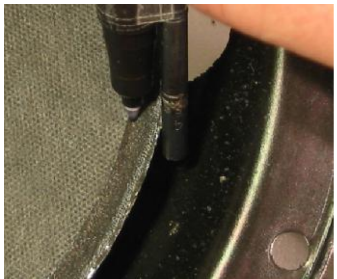
16. Kijk wel goed of de richtlijn straks onder de foamrand komt. Let op! De oude plakrand hoeft niet persé overal even breed te zijn.