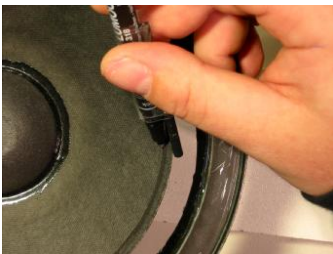
15. U kunt zonder richtlijn, uit de hand de lijn opbrengen. Als u er voor zorgt dat de lijn op de conus net iets onder de foamrand komt, wordt de afwerking eenvoudiger en mooier. Voor de fijnproevers: plak een boortje aan een Steadler fijne stift vast.