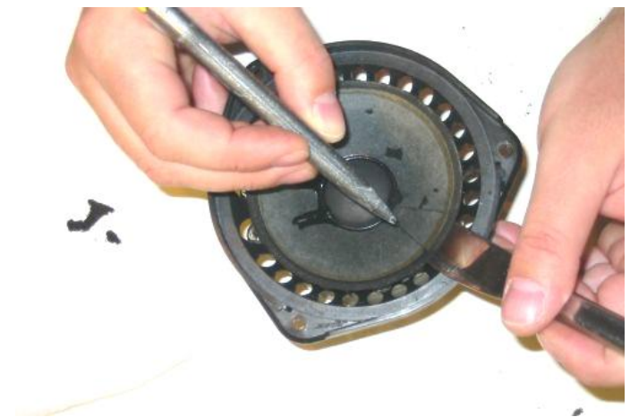
12. Is de conus minder dik en stevig, gebruik dan een boterhammes als ondersteuning.