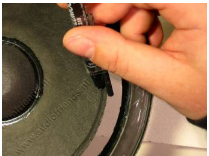
16. Kijk wel goed of de richtlijn straks onder de foamrand komt. Let op! De oude plakrand hoeft niet persé overal even breed te zijn.