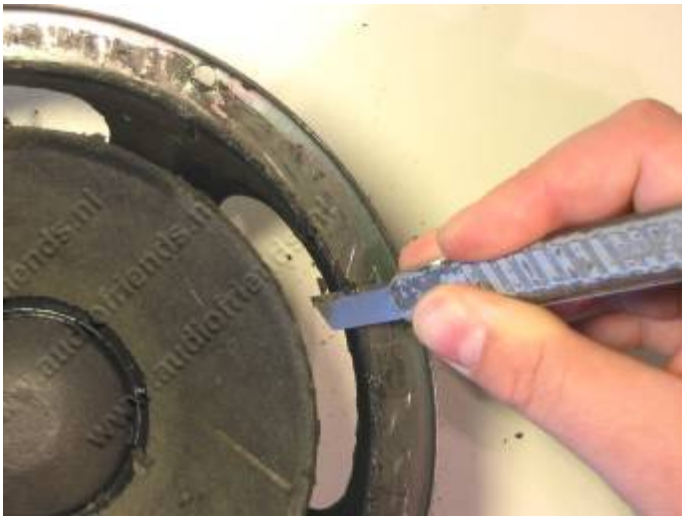
11. Schraap met de achterkant van het Stanley-mesje voorzichtig de zacht geworden foam weg.