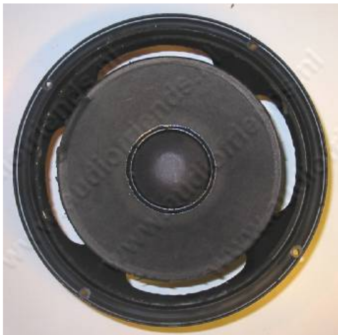
1. De unit vóór de revisie

Het reviseren gebeurt geheel op eigen risico. Lees de brochure eerst geheel door.