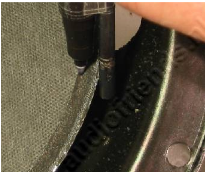
15. U kunt zonder richtlijn, uit de hand de lijn opbrengen. Als u er voor zorgt dat de lijn op de conus net iets onder de foamrand komt, wordt de afwerking eenvoudiger en mooier. Voor de fijnproevers: plak een boortje aan een Steadler fijne stift vast.