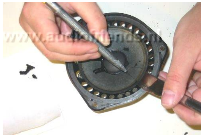
12. Is de conus minder dik en stevig, gebruik dan een boterhammes als ondersteuning.