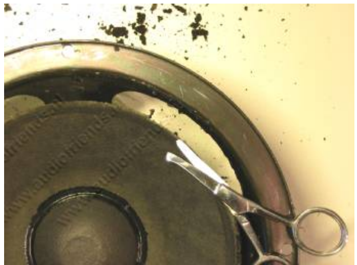
14. Deze knippen we er voorzichtig af met een klein schaarretje.