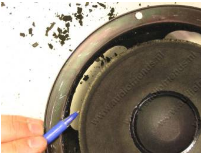
13. Er kan een uitstekende lijmlaag blijven zitten.